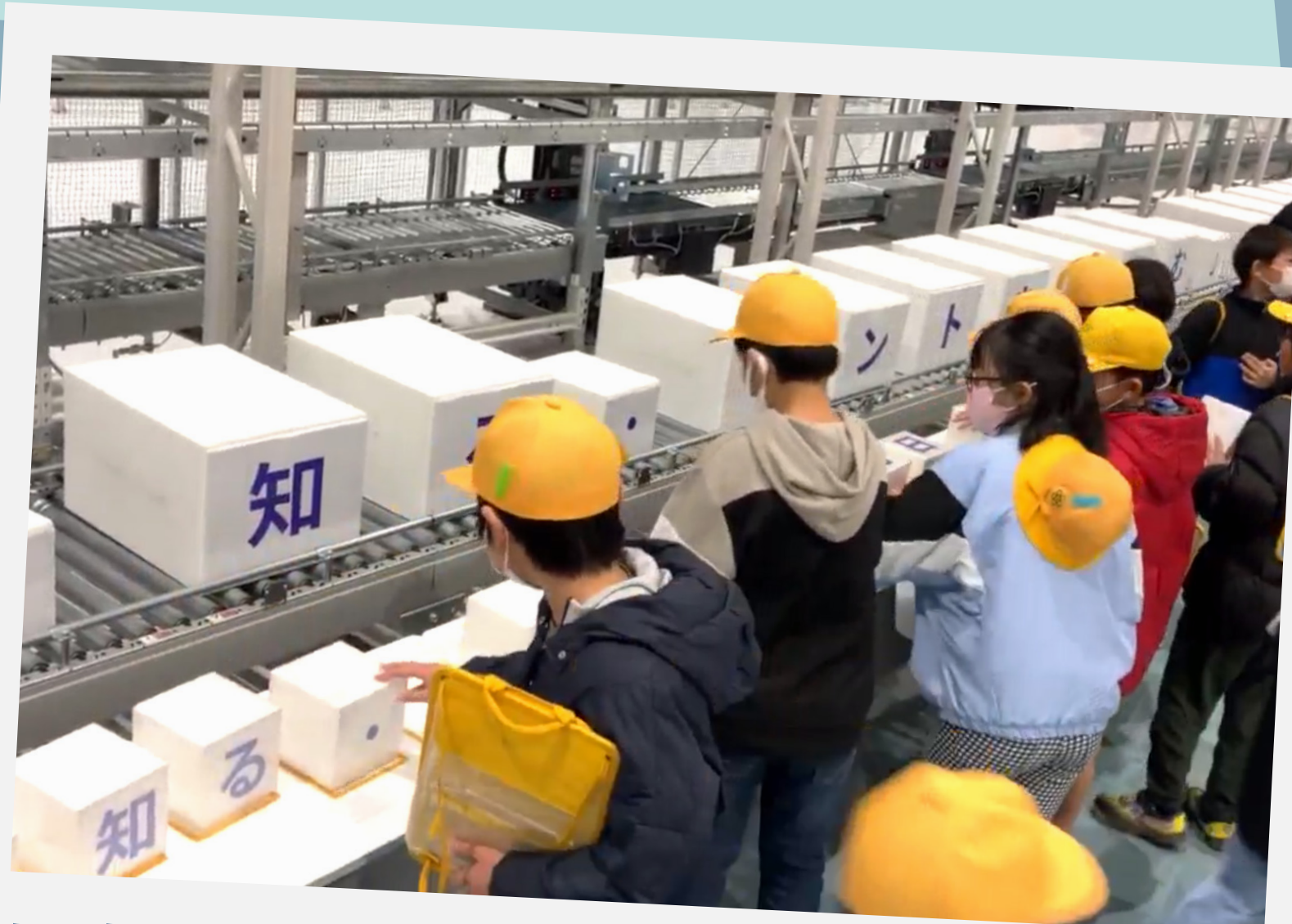
マテハンシステムと並べ替え競争