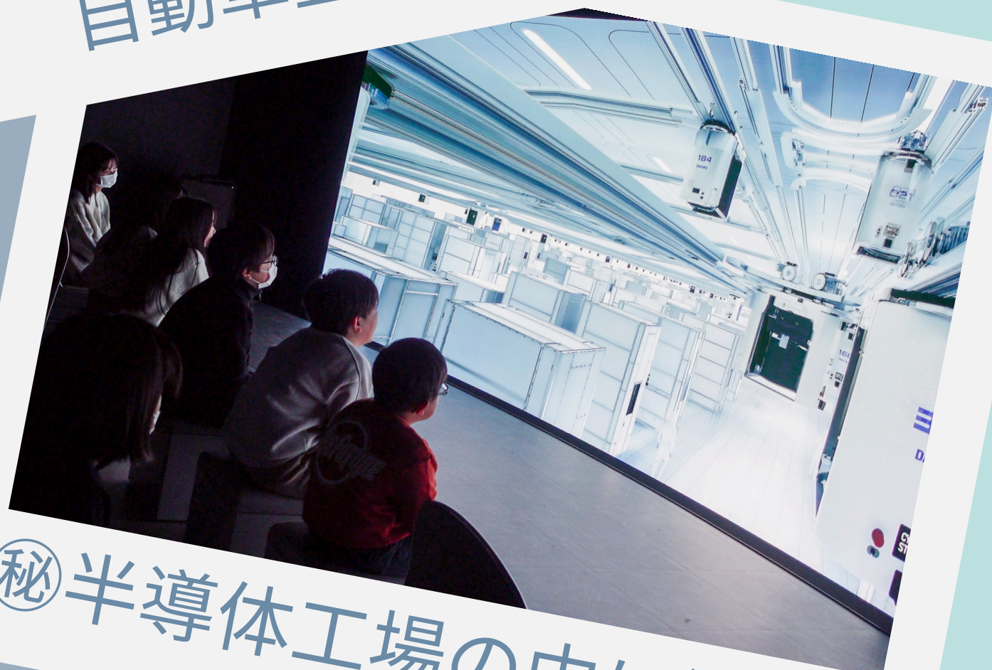
⑧半導体工場の中に潜入！