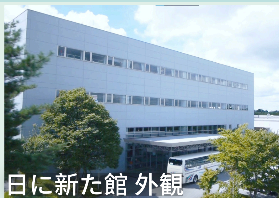
日に新たな館 外観

「日に新たな館」は、株式会社ダイフクの製造するマテリアルハンドリング（マテハン）システムを展示しています。社会や暮らしを支える「マテハン」の重要性をご紹介します。