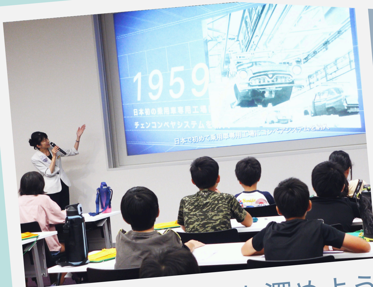
事前学習で理解を深めよう