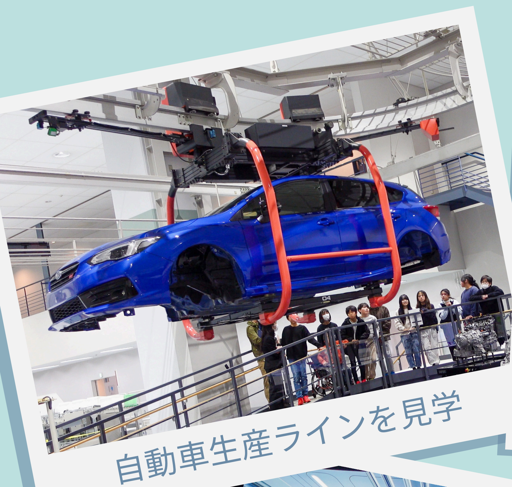
自動車生産ラインを見学

工場や倉庫でモノを動かす技術、マテリアルハンドリング（マテハン）システムがわかる！