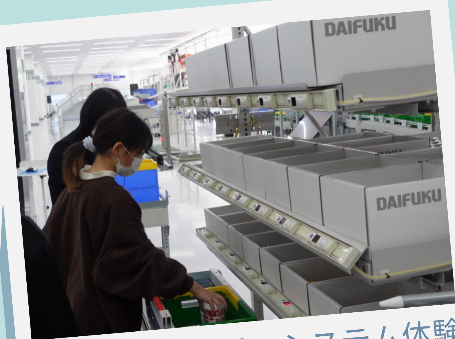
誰でも作業し易いシステム体験