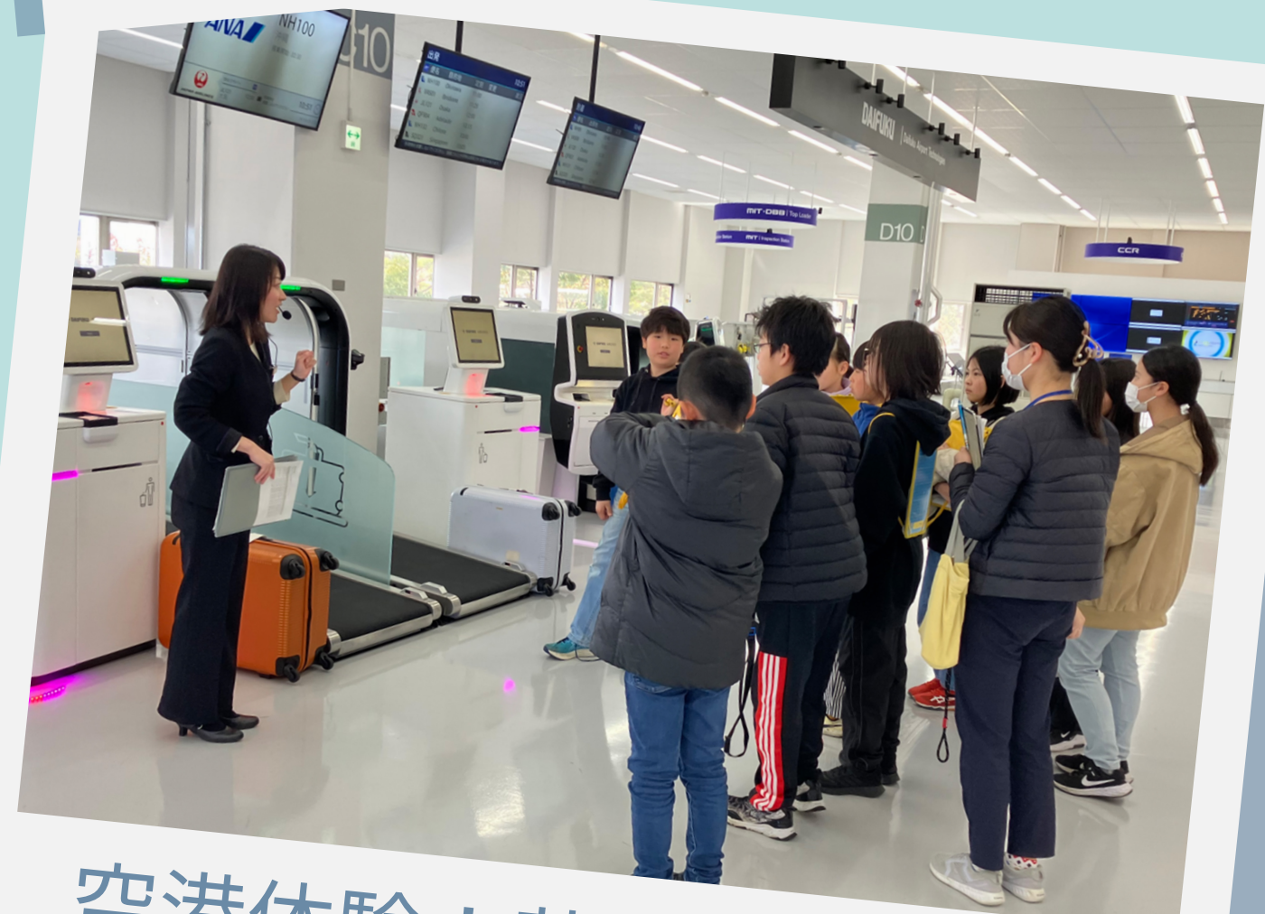
空港体験！荷物を預けよう！