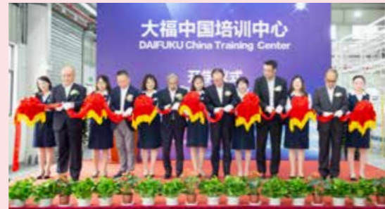
9月18日に執り行った開所式でのテープカット。

施設内には、サービス・メンテナンスの訓練や安全管理能力を高める訓練のために、実際に稼働している製品や巻き込まれ体感装置などを設置しています。