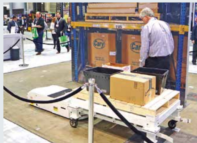
「SmartCart」を活用したピッキングのデモンストレーション。