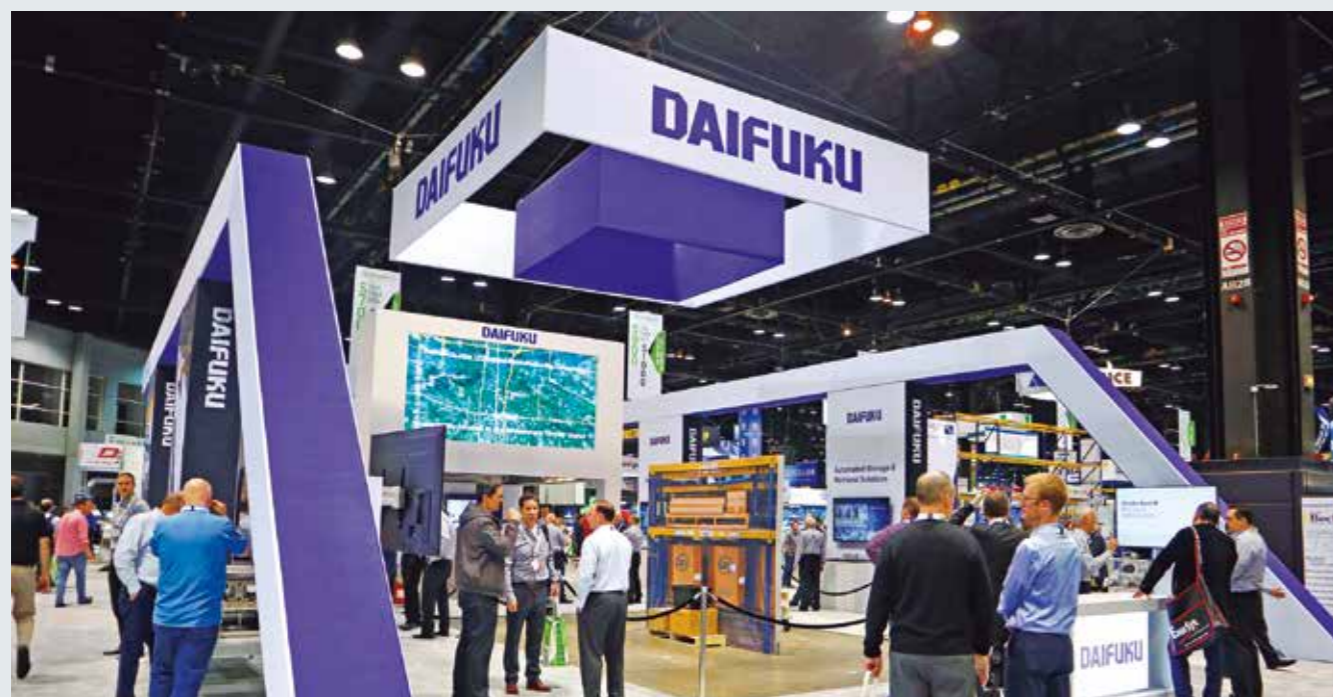
Daifuku North America Holding CompanyとWynright Corporationが共同出展。

さらに会期中、当社グループ会社のWynright Corporationのマテハン展示場「Innovation Center」や当社システム納入先の見学ツアーも実施しました。