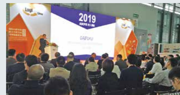
大福(中国)物流設備有限公司の営業責任者が講演。

当社ブースには、食品・医薬品・機械メーカーを中心に、約500人にご来場いただきました。