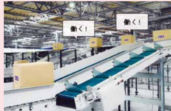
当社公式YouTubeチャンネルでご覧いただけます。 https://youtu.be/3KmpocCbQl4

2021年4月より、当社は新テレビCMの放映を開始しました。ネットショッピングの激増や人手不足対応などを背景に、24時間働き続ける当社のマテハンシステムと、システム導入によって生み出される提供価値をコミカルに表現。不満を言いながらも健気に働く擬人化されたマテハンシステムたちの言葉やセリフを画面上に散りばめ、テンポの良い音楽に合わせて、幅広い層の視聴者に向けて印象に残る映像に仕上げました。