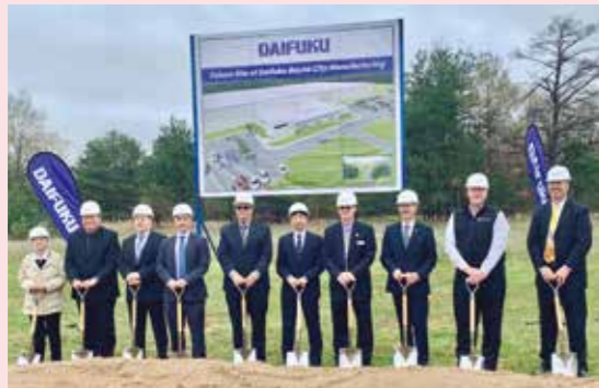
新工場の着工の様子。新工場は約2万㎡の敷地に建設され、2022年6月に完成予定。

新工場は生産能力拡大のため、ポインシティ、ハーバースプリングス、ペルストンの3工場を集約するものです。当社グループ会社のJervis B. Webb Company(本社:ミシガン州)が運営し、空港向けシステムや無人搬送車の生産を行います。