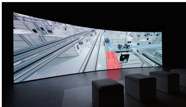
当社の製品・技術を体感できるシアター

世界最大級のマテリアルハンドリング・ロジスティクスの体験型総合展示場「日に新たな館（滋賀事業所内）」が、1994年開館以来の規模となるリニューアル